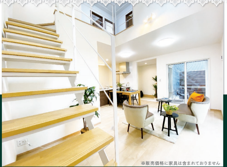
※販売価格に家具は含まれておりません