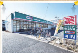
ドラッグセイムス(約700m)